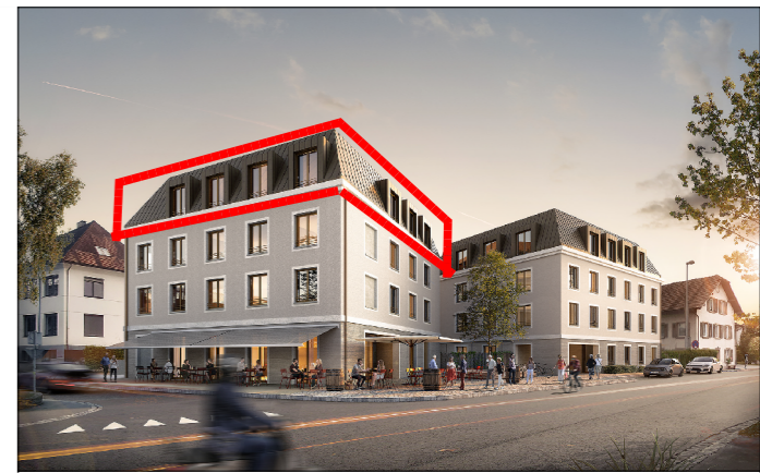
wohnanlage jahnstraße 6, lustenau penthouse | top A09 | obergeschoss 2 | haus A